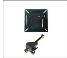
壁挂板/卡扣 (二选一)