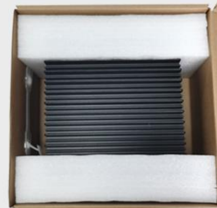
专用海绵防震保护