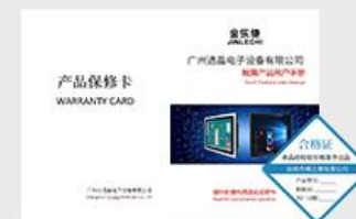
说明书&保修卡&合格证